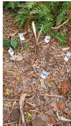
Pour vous recueillir, dans le bosquet, juste derrière

25 ans de travail acharné, en total bénévolat, 25 ans de poils à gratter sur différentes thématiques de santé. Nos statuts spécifient notre totale indépendance vis-à-vis d l'industrie pharmaceutique et autre lobbystes en santé et l'obligation de déclarer ses conflits d'intérêts.