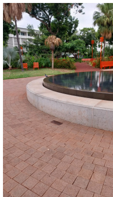
2eme chaise longue en partant de la gauche

C'est avec beaucoup d'émotion que le vendredi 28 novembre 2025 à 20h30, une dépose de graines a eu lieu. Cela aurait pu être une gerbe, mais celle-ci est réservée aux morts. Non, des graines de Moringa dédiées à la vie. Nous les avons plantées à deux pas de la préfecture de la Réunion, où 25 ans plus tôt très exactement, le 28 novembre 2000 était déposé les statuts de Med'Ocean. https://www.medocean.re/